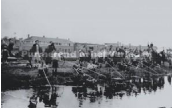
De Ganzensloot met op de achtergrond de Hugo de Grootstraat. De jeugd aan het vissen, bijna op elkaar, maar met veel plezier.