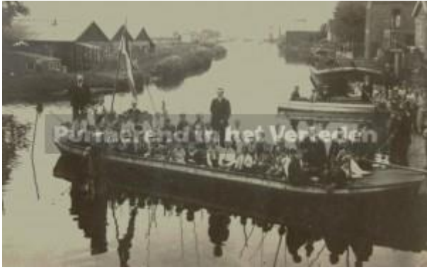
1980, een andere lichte sportvissers van de Afdeling XI Purmerend